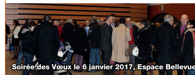
Soirée des Vœux le 6 janvier 2017, Espace Bellevue

Début janvier, près de 200 personnes étaient présentes à l'Espace Bellevue pour les Vœux de la Municipalité. M. le Maire a accueilli les nouveaux arrivants installés sur la commune en 2016. M. Guillot a poursuivi la soirée par son discours et a évoqué les différents projets menés sur la commune. M. Coureau, Maire de Monnières, est également intervenu au nom de la nouvelle communauté d'agglomération avant de partager un temps convivial avec les Gétignois présents.