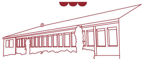
LE RELAIS DES PETITS GÉTIGNOIS

Chaque midi, les repas sont préparés par Restoria. Quatre personnes assurent la restauration en privilégiant les produits locaux et de saison. L'équipe se charge également de la gestion des déchets.